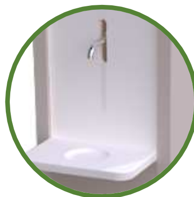
Façade et Tablette « stop goutte » en compact