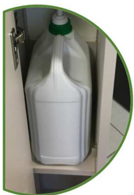
Tablette réglable pour bidon de 5L

Dimension : Ht : 132 cm Larg : 30 cm Prof : 34 cm